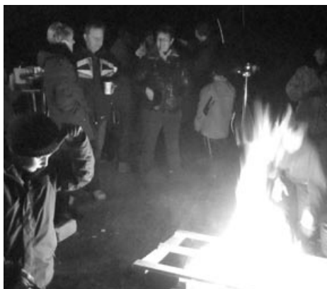
Weihnachtsfeier der Tennisabteilung bei allerbesten Stimmung am Lagerfeuer.

So fand lediglich als einzige Veranstaltung des Winterhalbjahres unsere Weihnachtsfeier auf der WSV-Anlage statt. Wie im vergangenen Jahr trafen sich am 11. Dezember »Klein und Groß« um ein großes Lagerfeuer zur vorweihnachtlichen Feier der Tennisabteilung. Bei Glühwein, Kinderpunsch, selbst gebackenen Plätzchen und gegrillten Bratwürstchen verbrachten wir gemeinsam den Nachmittag des 3. Advent. Leider haben auch hier, neben unseren »Kleinsten«, deren Eltern und der Abteilungsleitung keine weiteren Mitglieder mitgefeiert.