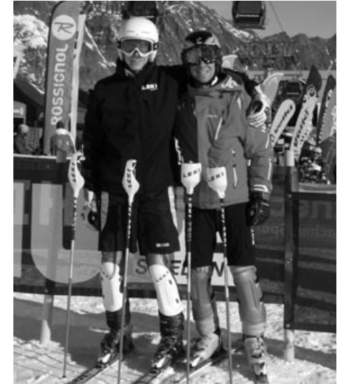
Die WSV-Skijugend on Tour: Beim Saisonaufakt auf dem Stubaier Gletscher (links oben), bei der 2. Jugend-Skireise nach Wagrain (links unten) und bei den Skirennen der Wintersaison (rechts).

Wegen der Kälte im Februar verlegten wir das traditionelle Lakefleischessen von Jakobsthal kurzerhand in das Vereinsheim. Denn bei diesen frostigen Temperaturen hätte es im Freien bestimmt nicht jedem so gut geschmeckt. Allerdings soll diese Veranstaltung im nächsten Jahr wieder in Jakobsthal stattfinden, sofern es nicht wieder diese eisigen Temperaturen gibt.