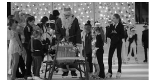
Der Nikolaus beim Weihnachts-Schaulaufen 2011.