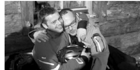
Skifreizeit in Wagrain.