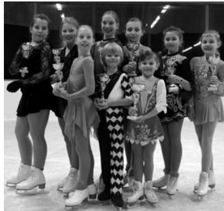
Unsere 10 Erstplatzierten Jugendlichen (oben) und unser komplettes WSV-Aufgebot (unten) an den Unterfränkischen Meisterschaften 2011.