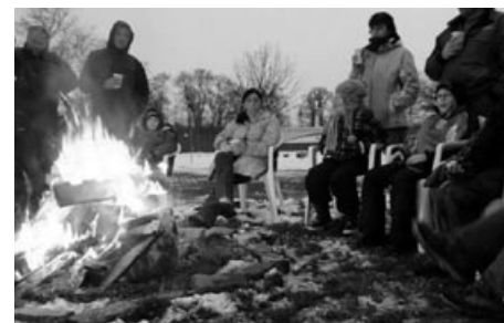
Nikolausfeier auf dem WSV-Gelände. Weitere Bildergalerien zu den Events 2010 unter: www.wsv-aschaffenburg-tennis.de

Am 5. Dezember trafen sich »Klein und Groß« auf dem verschneiten WSV-Gelände um ein großes Lagerfeuer zur vorweihnachtlichen Nikolausfeier der Tennisabteilung. Bei Kinderpunsch, Glühwein sowie leckeren Plätzchen und gegrillten Bratwürstchen warteten die Kids gespannt auf den angekündigten Besuch des Nikolauses. Dieser enttäuschte unsere jüngsten Tenniscracks natürlich nicht, denn er hatte trotz seines beschwerlichen Anmarsches durch den Schönbusch für jeden von ihnen eine kleine Überraschung mitgebracht.